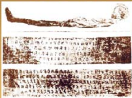
Calendario sacrale del II secolo a.C. di area cortonese o perugina,

tagliato e riutilizzato per far bende di una mummia in Egitto