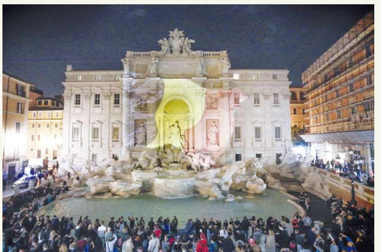
La fontana di Trevi a Roma illuminata con i colori della bandiera belga martedì scorso - tributo alle vittime degli attacchi terroristici a Bruxelles che ha lasciato almeno 31 persone morte.

un borsone ed è andato via. Il borsone conteneva la carica esplosiva più potente". Il quadro delle indagini, al momento, è questo: ci sono due attentatori suicidi, due fratelli belgi, identificati. Il maggiore, Ibrahim El Bakraoui, che avrebbe compiuto trent'anni il prossimo 9 ottobre, si è fatto esplodere in aeroporto. Il minore, Khalid, 27 anni compiuti da poco, ha colpito la stazione della metropolitana di Maelbeek. Un minuto di silenzio è stato osservato mercoledì scorso nell'atrio al piano terra di palazzo Berlaymont, sede della Commissione Europea, in memoria delle vittime degli attentati che hanno colpito il giorno precedente l'aeroporto di Bruxelles Zaventem e la stazione della metropolitana di Maelbeek. In prima fila, il presidente della Commissione Europea Jean-Claude Juncker, il re dei Belgi Philippe e la regina Mathilde, il primo ministro belga Charles Michel e il primo ministro francese Manuel Valls. /edr/ps