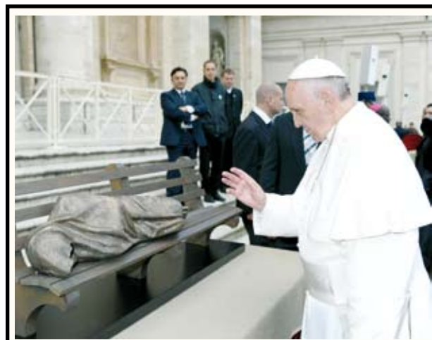
Qui in una foto col Papa del 20 novembre 2013, a grandezza naturale, rappresentato come un senzatetto sdraiato su una panchina è stata collocata in Vaticano, proprio all'ingresso degli uffici della Elemosineria apostolica nel cortile Sant'Egidio, in occasione della settimana santa dell'Anno santo della misericordia, 23 marzo 2016.