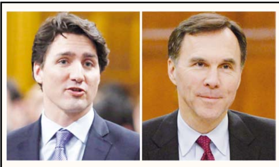
Il Primo Ministro Justin Trudeau e il ministro delle finanze Bill Morneau

SEGUE DA PAG 1 TRUDEAU ... previsto la prima misura è quella di assistere le famiglie di basso o medio reddito: il buono per i figli minorenni indetto dal governo precedente sarà abolito e rimpiazzato con uno non tassabile, offrendo alle famiglie un aumento del 2.300$ annuali. La