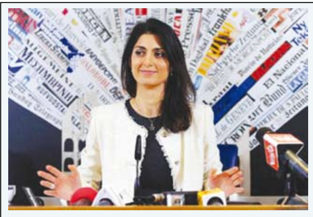
Virginia Raggi, candidata sindaco per il M5S a Roma

Le Elezioni comunali 2016 a Roma si terranno nel mese di giugno.