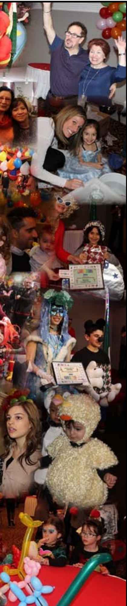
nature. e di consueto, tutti i inini, dai più piccoli ai grandi, si sono deliziati no al gradito buffet zza offerta da John ley, hot dogs offerti affè la Grotta e dolci evaleschi offerti dalla cceria Gelateria Italiana. rnevale dei Bambini a va è un'attività unica uo genere, non solo né è organizzata da 25 ciazioni, ma ha anche