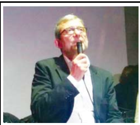
Roberto Giachetti, candidato di centro sinistra

Si avvicina la data in cui il Comune di Roma avrà il suo nuovo sindaco. Dopo le dimissioni di Marino l'anno scorso, il Comune di Roma è stato affidato temporaneamente al commissario straordinario Francesco Paolo Tronca. Ma presto i cittadini romani saranno chiamati alle urne, per eleggere il nuovo sindaco della capitale italiana. La lotta tra i vari candidati sta entrando nel vivo,