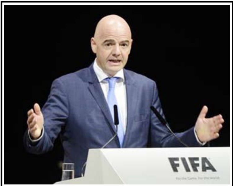
Il neo eletto presidente della Fifa, Gianni Infantino

La Fifa ammette che furono pagate tangenti per l'assegnazione al Sudafrica dei Mondiali 2010 e contestualmente si rivolge alle autorità statunitensi con una richiesta di risarcimento danni nei confronti di 41 ex dirigenti e funzionari coinvolti nell'inchiesta sullo scandalo corruzione. L'obiettivo, spiega la Fifa in una nota nella quale si definisce "istituzione vittima", è quello di "recuperare decine di milioni di dollari intascati illegalmente dai membri della Fifa corrotti e altri funzionari del calcio". Fra questi, la Fifa cita in maniera esplicita alcuni alti dirigenti incriminati dal Dipartimento di Giustizia statunitense, fra i quali Chuck Blazer, Jack Warner,