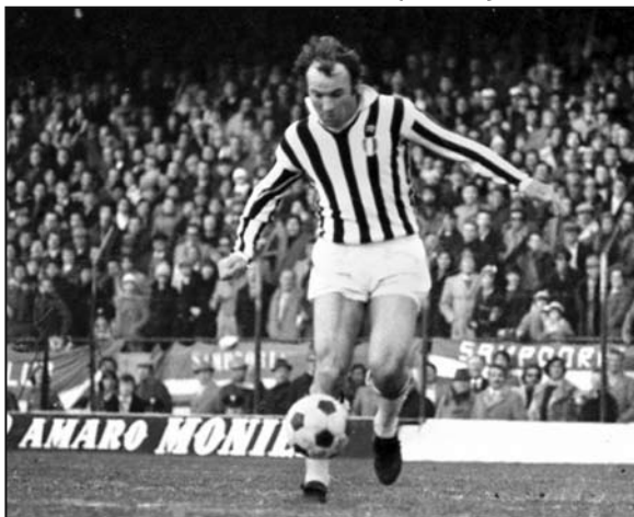
Altafini con la maglia della Juventus: nel 1975 decise una sfida scudetto col Napoli