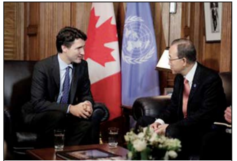
Il Primo Ministro canadese, Justin Trudeau, a colloquio con il Segretario generale delle Nazioni Unite, Ban Ki-moon

Il Segretario Generale delle Nazioni Unite in visita a Ottawa in colloquio con il Primo Ministro sul ruolo del Canada nella azioni umanitarie e contro il terrorismo