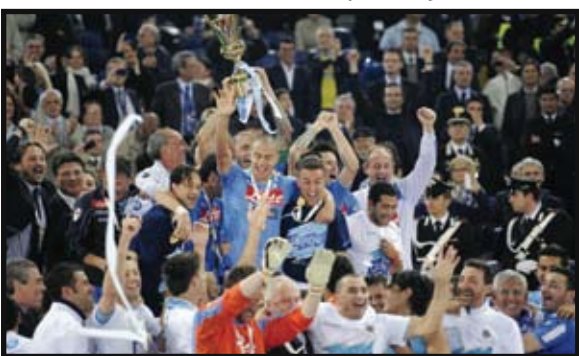
Finale Coppa Italia 2011-12 il Napoli batte la Juve 2-0