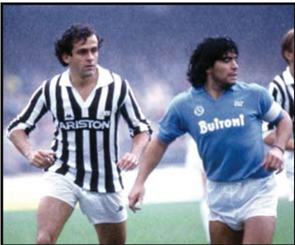
Platini e Maradona negli anni 80

Prima di loro, però, il romanzo di Juventus-Napoli ha scritto altre pagine importanti e vissuto di protagonisti non banali. Come dimenticare Altafini e il suo gol da ex che tagliò le gambe ai partenopei? Oppure, in tempi più recenti, le polemiche feroci per le finali di Coppa Italia e Supercoppa. sabato scorso si sono sfidate ancora una volta (la stampa nel nostro giornale ha preceduto la partita). Alcune immagini qui sotto daranno un'idea della lunga storia di rivalità fra queste due squadre. □