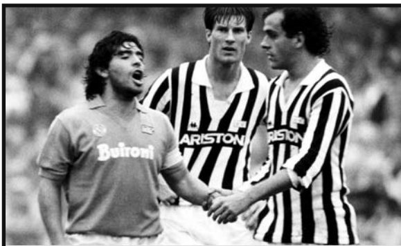
Classica immagine di Diego Maradona contro la Juve