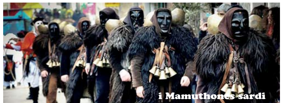
i Mamuthones sardi

Assolvere 'parte 'e unu debitu; pagare parte di un debito. ©