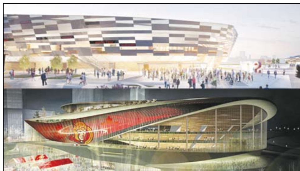
La foto sopra mostra le due proposte per una pista del ghiaccio a LeBreton Flats. Il alto è il progetto CANADENSIS (di Devcore, Canderei, DCDLS); mentre quella sotto è del gruppo ILLUMINATION (RendezVous LeBreton, Ottawa Senators)

i loro disegni: il Canadensis [Devcore Canderel DLS Group — sostenuto da Guy Laliberté, fondatore e proprietario del Cirque du Soleil, e dal miliardario quebecchese André Desmarais] e l'IllumiNation [di RendezVous LeBreton,