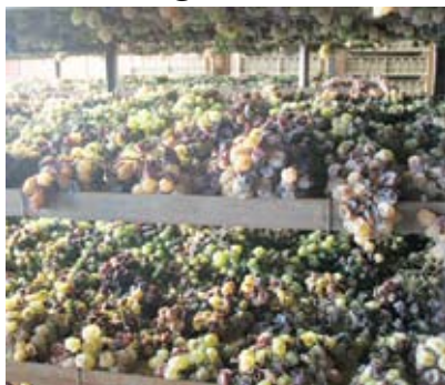
L'uva vespaiola in appassimento