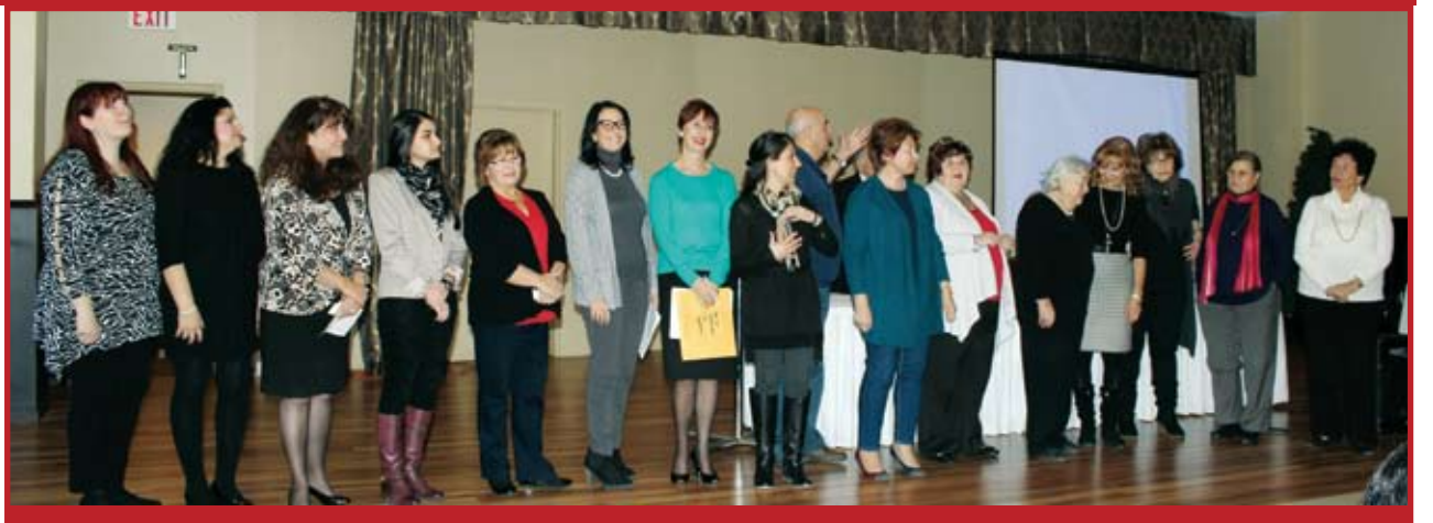
16 dei 20 candidati che si sono presentati per le elezioni del nuovo comitato di Tele-30 [4 erano assenti]

L'appello a un'assemblea dei soci di Tele-30 è risultato nell'elezione di 11 nuovissimi membri per il consiglio direttivo. Sentimenti di delusione per alcuni dei candidati che avevano servito Tele-30 per decine di anni [articolo a pag. 3: Tele-30 ]