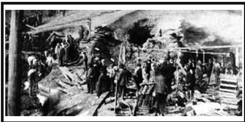
Una immagine del disastro di Monongah, West Virginia

Si è tenuta nella "Sala Stampa" della Camera dei Deputati la Commemorazione del Disastro Minerario di Monongah, la più grande tragedia del mondo del lavoro e dell'emigrazione Italiana.