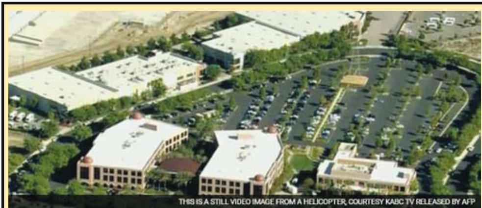
THIS IS A STILL VIDEO IMAGE FROM A HELICOPTER